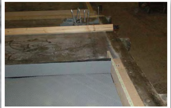
Proofex Engage monteres i støbe- formen til hjørne- elementet.