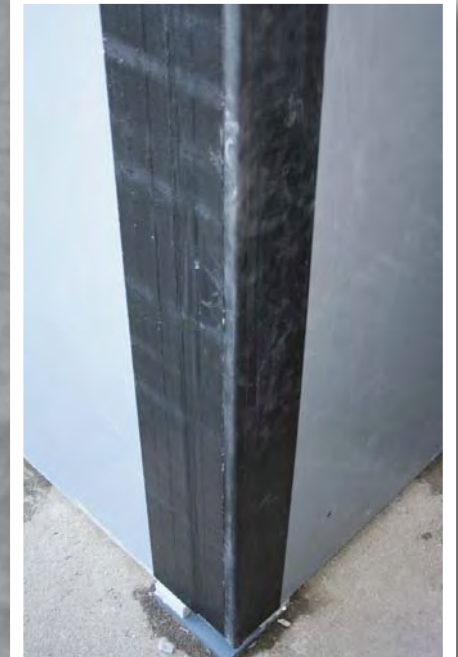
Hjørnesamling vises med Proofex L-section/ Proofex Detail Strip.