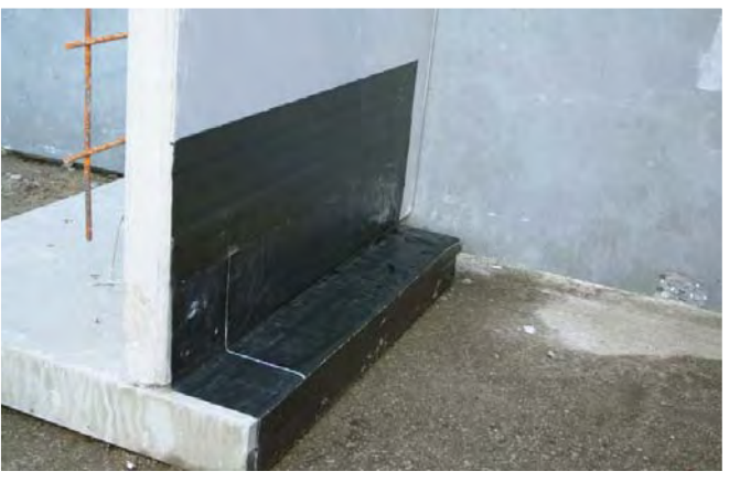
Filigranelement / element - Løsningsforslag til tætning af element/fundament med fredsring udført med Proofex 3000 og Proofex Detail Strip.