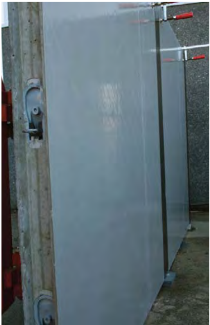
Element med Proofex Engage. Samling vises med Proofex Detail Strip.