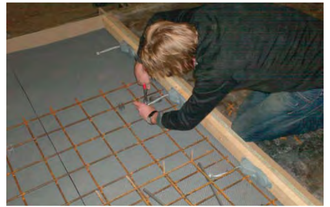
Armeringsjern og afstandsstykker tilpasses i støbeformen.